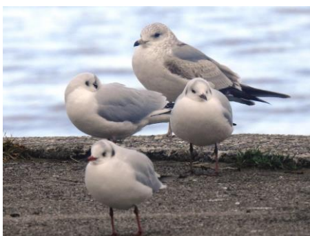
Sturmmöwe mit Lachmöwen

Die Sturmmöwen haben hellgelbe Beine und ebensolchen Schnabel mit etwas Schwarz gegen die Spitze. Bei den noch grösseren Arten hat die Mittelmeermöwe intensiv gelbe Beine – bei der Steppenmöwe sind sie blasser -, während sie bei der Silbermöwe fleischfarben sind.